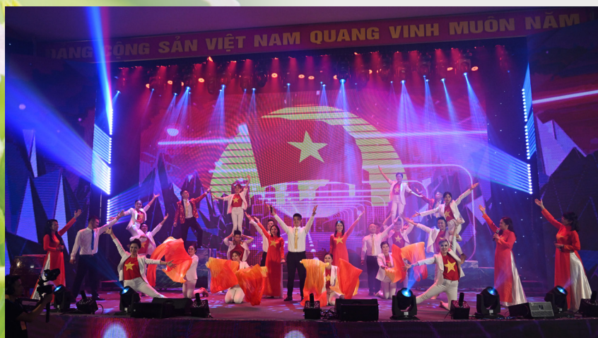
Giải Bạc hạng mục Tốp ca với liên khúc “Vinataba - Việt Nam ngày nắng mới”