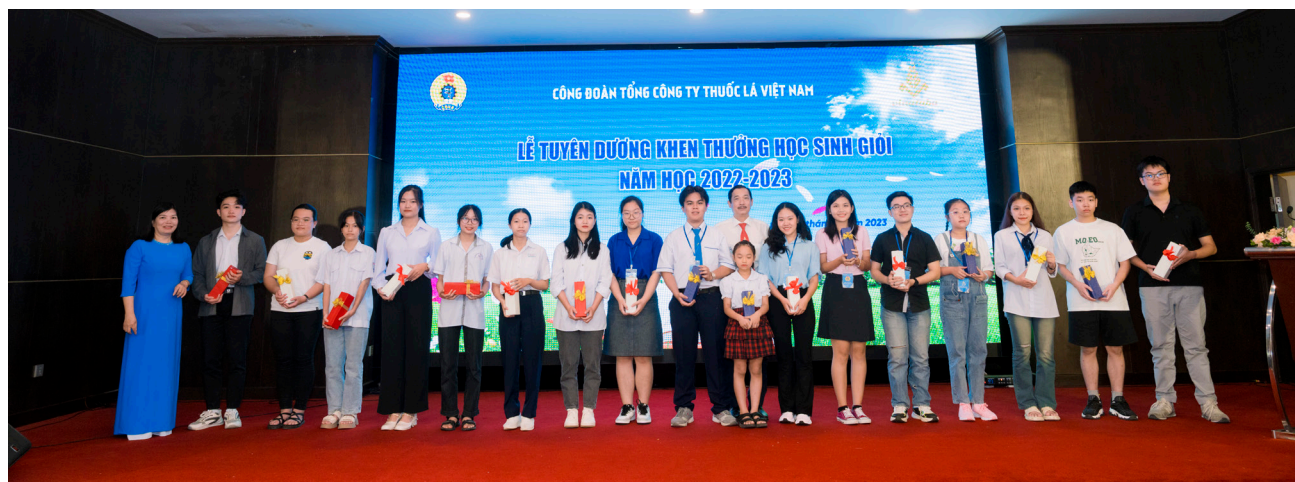
Khen thưởng các cháu Học sinh giỏi, tiêu biểu năm học 2022 - 2023

Tại Lễ tuyên dương, các cháu học sinh giỏi tiêu biểu xuất sắc đã báo cáo thành tích học tập, chia sẻ phương pháp, kinh nghiệm học tốt các môn học, đồng thời bày tỏ sự biết ơn đối