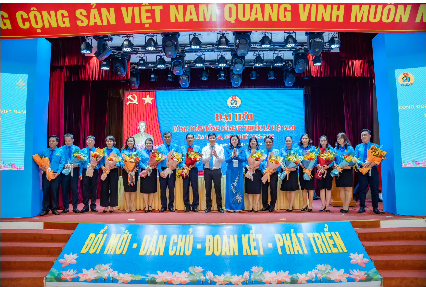
Ra mắt Ban chấp hành Công đoàn Vinataba, nhiệm kỳ 2023 - 2028