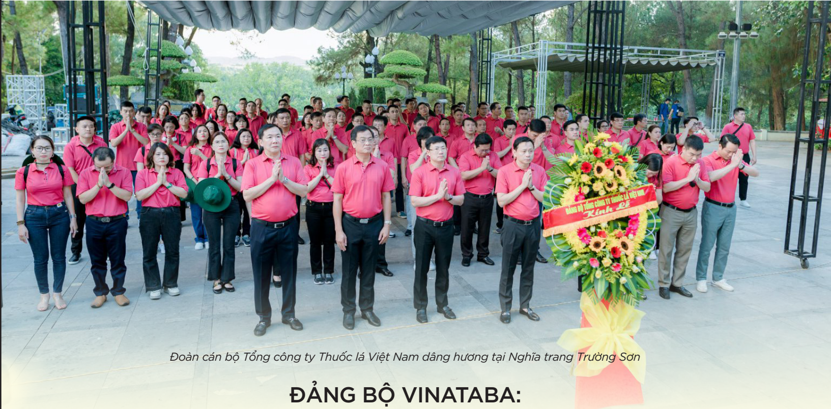
Đoàn cán bộ Tổng công ty Thuốc lá Việt Nam dâng hương tại Nghĩa trang Trường Sơn