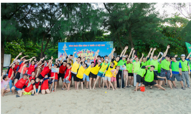
Team building trên bãi biển Cửa Lò

Việc kịp thời khen thưởng con cán bộ, công nhân viên bằng những phần thưởng xứng đáng là cách mà các cấp Công đoàn của Tổng công ty thuốc lá Việt Nam đã, đang và sẽ tiếp tục thực hiện nhằm ghi nhận sự nỗ lực, cố gắng của các cháu, sự đồng hành của bố mẹ với các con, biểu dương những tấm gương vượt khó, học giỏi, từ đó lan tỏa, nhân rộng tinh thần hiếu học, ý thức vượt khó vươn lên của các cháu. Đây là một hoạt động mang giá trị nhân văn rất tốt đẹp với mong muốn tạo thêm nguồn động lực để các cháu nỗ lực hơn nữa phấn đấu đạt được những kết quả như mong đợi, là những con ngoan, trò giỏi và sau này sẽ trở thành những công dân có ích cho xã hội cho dù ở bất kỳ vị trí nào ❖