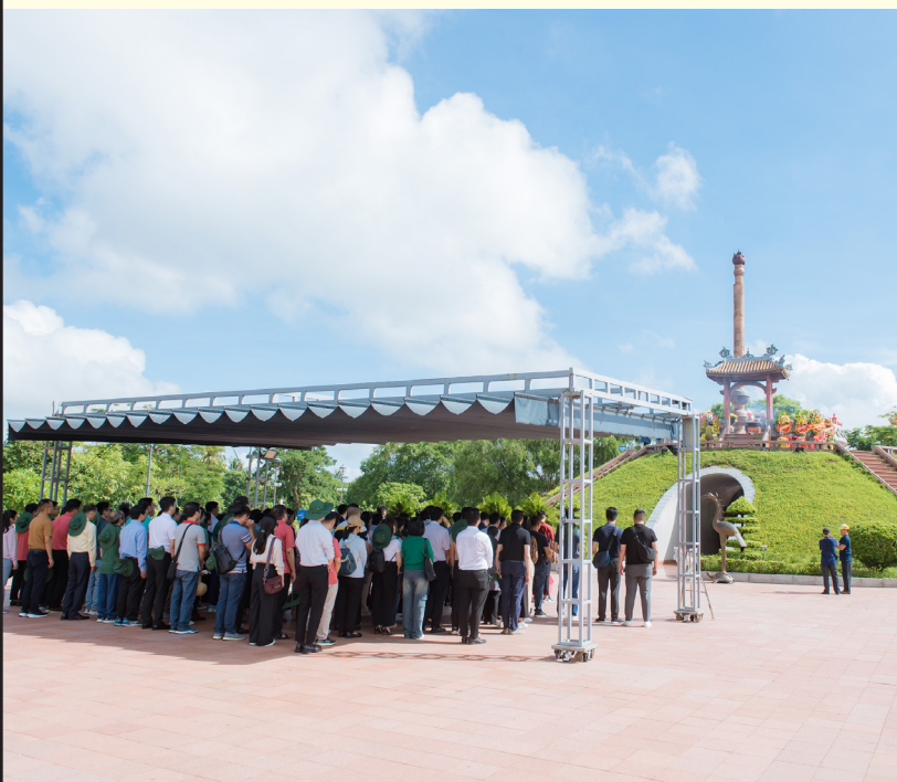
Dâng hương tại Thành cổ Quảng Trị