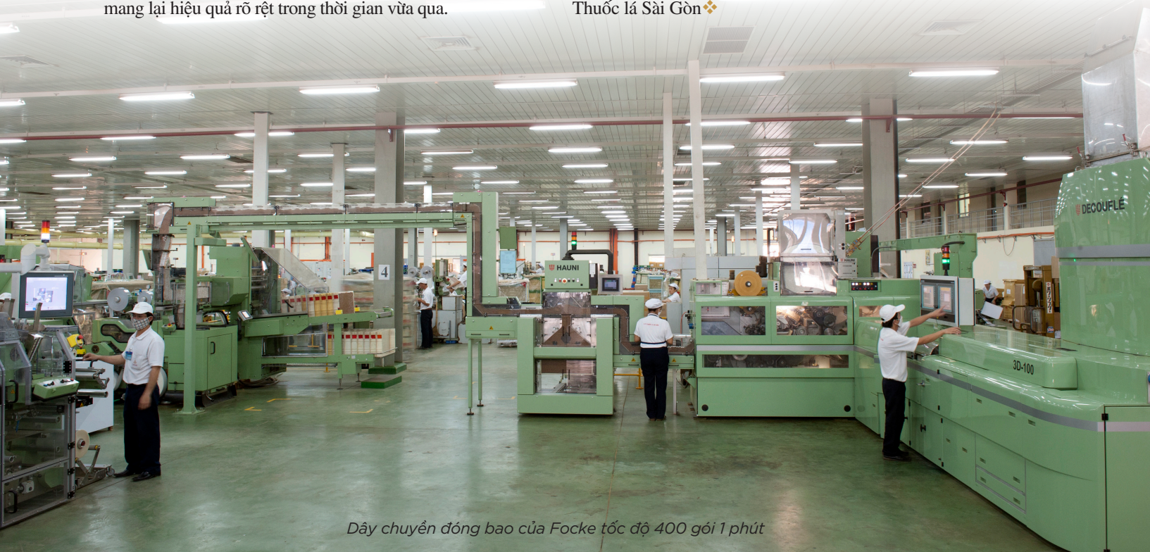
Dây chuyền đóng bao của Focke tốc độ 400 gói 1 phút

Thành công của Hội thảo lần này là tiền đề để Công ty Thuốc lá Sài Gòn đặt nhiều kỳ vọng trong việc ứng dụng thành tựu khoa học, công nghệ vào hoạt động sản xuất kinh doanh, tạo nền tảng phát triển bền vững và gia tăng lợi thế cạnh tranh cho toàn nhóm công ty mẹ - công ty con Công ty Thuốc lá Sài Gòn ❖