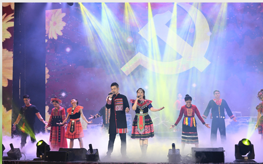
Giải Bạc hạng mục song ca, tiết mục “Có Đảng sáng soi vững bước ta đi”