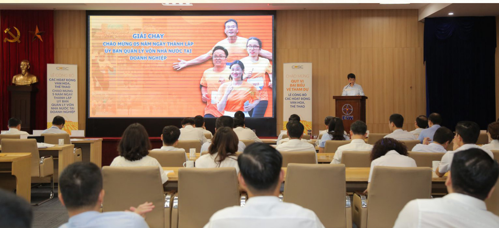
Ban tổ chức công bố các hoạt động thể thao

Nhằm thu hút sự hưởng ứng nhiệt tình tham gia của cán bộ, người lao động, đại diện lãnh đạo các tập đoàn, tổng công ty đã chỉ đạo công tác thông tin tuyên truyền sâu rộng tới các đơn vị, người lao động về chuỗi hoạt động thể thao, văn nghệ, tạo điều kiện, khuyến khích cán bộ, người lao động tham gia hăng hái, tích cực. Bên cạnh đó, các cán bộ phụ trách công tác truyền thông báo chí của Ủy ban và các doanh nghiệp trực thuộc được giao nhiệm vụ làm tốt công tác thông tin tuyên truyền, quảng bá hình ảnh của Ủy ban và chuỗi hoạt động trên các phương tiện thông tin đại chúng, mạng xã hội, cổng thông tin, các kênh truyền thông nội bộ, qua đó nổi bật mục đích, nội dung, thể lệ