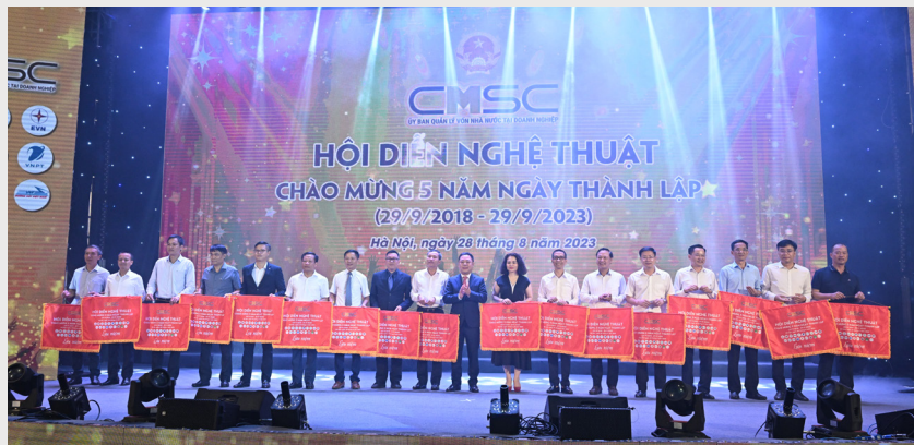
Lãnh đạo Ủy ban trao cờ lưu niệm cho các đơn vị tham dự Hội diễn

Hội diễn nghệ thuật đã mang lại không khí vui tươi phấn khởi cho cán bộ nhân viên người lao động và đáp ứng được nhu cầu sáng tạo, xây dựng văn hóa doanh nghiệp.